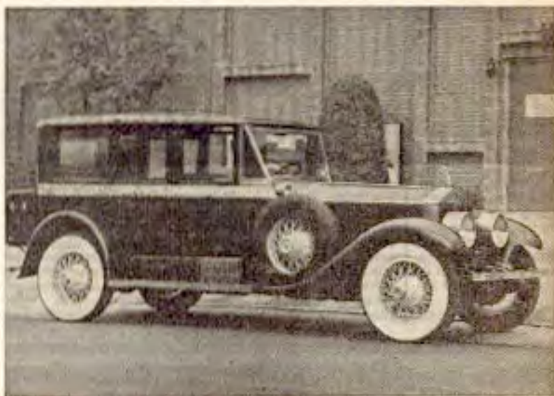
■ In Frankfurt mit viel Liebe fürs Detail aufgemöbelt — in Baden-Baden bald im Oldtimer-Museum der Kur- und Bäderverwaltung zu besichtigen: Ein Rolls-Royce Silver Ghost, Baujahr 1924. Die US-Staatskarosse hat einen Schätzwert von rund 100 000 Mark.